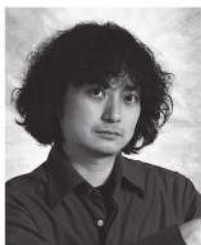
演出 粟國 淳