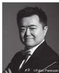
指揮 園田隆一郎 Conductor: SONODA Ryuichiro