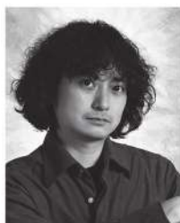
演出 栗國 淳 Production: AGUNI Jun